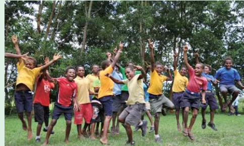
自慢の森をバックにみんなで

加したり、木の手入れをしたり、環境保護の大切さについての授業にも熱心に参加しています。最近では、学校の敷地内で落ち葉や草を集めてたい肥を作り、苗木を植える時に使っています。森の成長とともに、子どもたちの環境保護意識も高まっています。