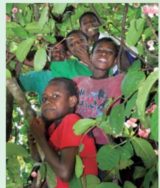
ラウラウの木に登り実を食べる子どもたち