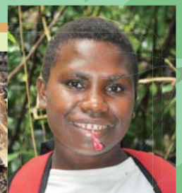
甘いアーホンの花