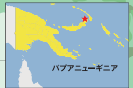
パプアニューギニア