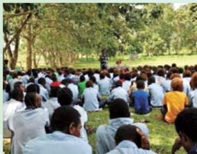
涼しい木陰での朝会

長年にわたって地道に植えられた木々は立派な森へと成長し、広くて涼しい木陰をつくり出しています。涼しい森の中で朝会が開かれ、子どもたちは空き時間を見つけては木陰に集まって遊んだり、マンゴーやスターフルーツなどの