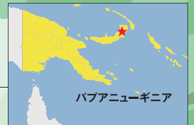
パプアニューギニア