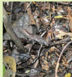
木の枝に似たイリンガ

しかし近年、この地域でも開発が進み、人々が今後も森の恵みを楽しむのが危ぶまれています。「子供の森」計画の活動を通じて、環境を守る大切さを学んでいます。