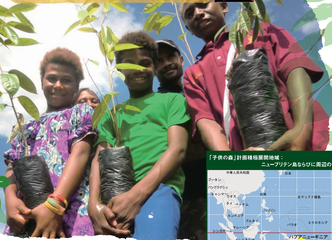
「子供の森」計画積極展開地域： ニューブリテン島ならびに周辺の島々