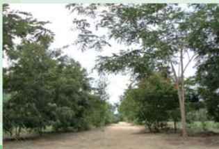
大きく生長した木々が校舎へ続く道へと導いてくれます

2009年から「子供の森」計画に参加した同校では、これまでに学校の敷地と村の入口に合計320本の木を植えました。1年目に敷地内に植えた木はほとんど枯れることもなく、今ではすっかり大きくなりました。これも、子どもたちが毎日よく木を観察し、手入れをしてきた成果です。いよいよ実が付き始めた5本のパパイヤの木も、子どもたちはその実を数えながら大きくなるのを楽しみに待っていました。ところがある日、心無い人によってパパイヤの木が全部切られてしまうという悲しい出来事がありました。それでも子どもたちはドラゴンフルーツの木を4本新たに植えて、元気を取り戻しさらに大切に育てています。ドラゴンフルーツの木は村でもめずらしく、大人たちも学校まで見