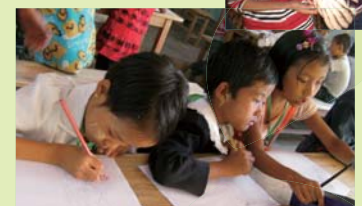
自然の風景に思い思いの色を塗って、日本の皆さんへ送りました