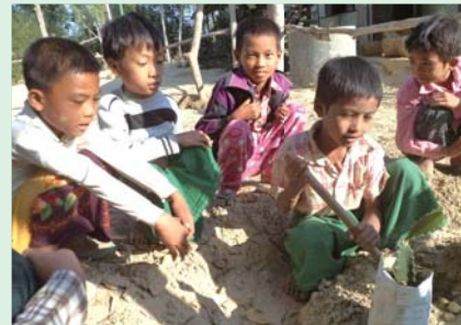
ドラゴンフルーツの苗を植える子どもたち

「子供の森」計画の活動は新しい体験をする機会となり、みな興味津々に次の活動を楽しみにしています。