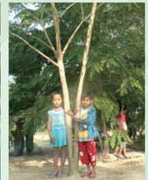
植樹後3年が経ち、子どもたちの背丈よりもはるかに高くなりました