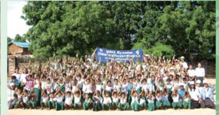
活動がよいよ始まりました