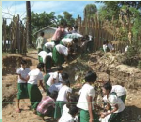
学校裏の傾斜地でビニールごみを拾い集める子どもたち

タンピンチャウン小中学校は、2012年に新たに活動を始めた学校です。2haほどある敷地内にはそれまで十数本の木があるのみでしたが、インドセンダンやネムを中心に205本の木を植えました。また、学校裏の傾斜地に無造作に捨てられ、雨が降るとあちらこちらに流されていたビニールごみも、子どもたちが中心となり拾い集めました。その後、決められた場所に捨てるよう指導し、学校の敷地内の環境は各段に良くなりつつあります。