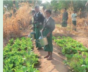
大根、白菜、レタス、カリフラワーを育てています

のかはあまり知られていません。子どもたちは徒歩で片道15分もかかるところにあるため池から毎日水を汲んできては水やりをし、ワクワクしながら野菜を育てました。野菜を収穫できたときはみんな大喜び。それぞれうちへ持ち帰って家族にも報告しました。活動を楽しみながら多くを学ぶ子どもたちの様子を、先生たちも喜びを感じながら見守っています。