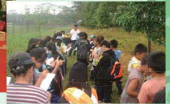
自然の大切さについて真剣に学ぶ子どもたち