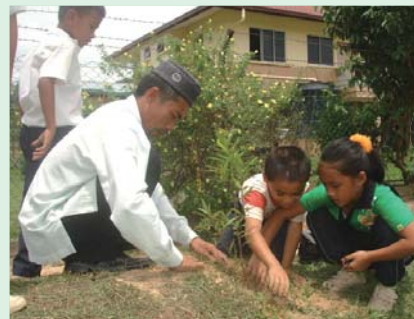
先生と一緒に木を植える子どもたち

森」計画の活動を始めたばかりの子どもたち。これからの活動を通じて、環境を守ることの大切さや森の役割などをさらに学んでいくことでしょ