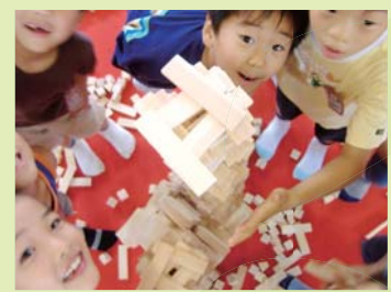
「森のつみ木広場」は子どもたちの協調性や創造力も育てます

参加した子どもたちは協力しあい大きな作品を作る喜びや達成感を感じると共に、紙芝居によって日本の森林の現状や森の大切さを学んでいます。詳しくはホームページをご覧ください。www.morinotsumiki.com