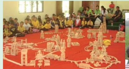
みんなで一つの大きな作品をつくりました

今回の森と遊ぶイベントで、自然の中で遊ぶことの楽しさや環境保護の意味を知った子どもたちは、これからも森を大切に守り育てて、次の世代へと引き継いでいくことでしょ