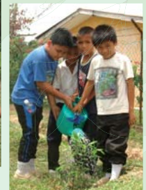
お水もしっかり! これからも続けていきます