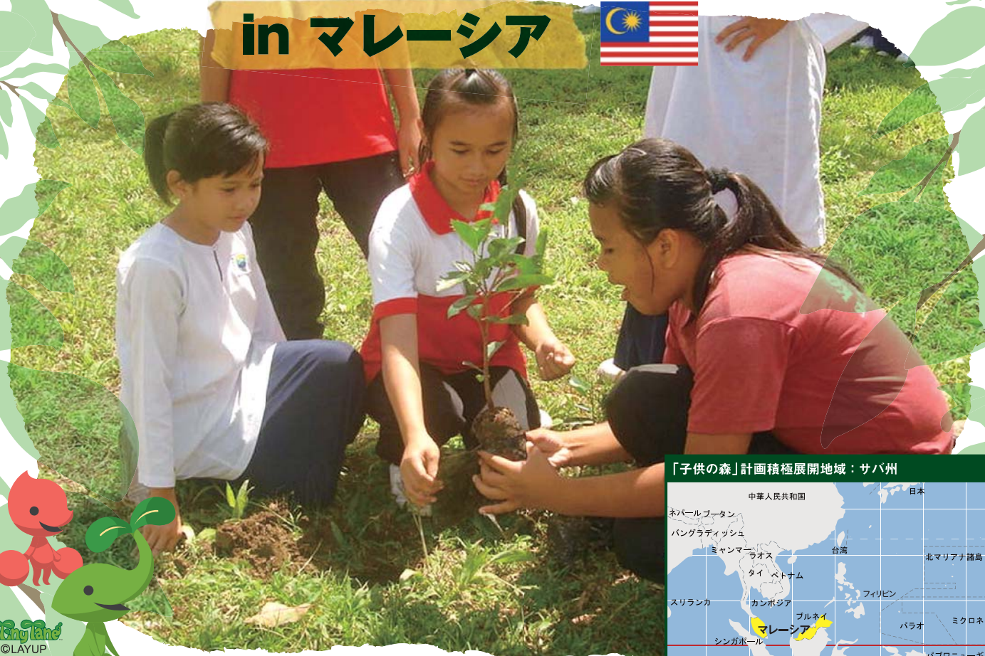
「子供の森」計画積極展開地域：サバ州