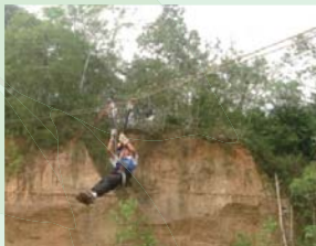
ターザンロープに大はしゃぎ

たちに知ってもらおうと「森と遊ぼう!」というイベントを開催し、約120名の子どもに加え、30名の先生や地元の教育省関係者なども参加しました。イベントでは、自然に親しむネイチャーゲームや、木と