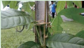
ヒモが足らず草をちぎって結ぶ。 子どもたちは臨機応変です

年々子どもの数が増え続けるハティマラ高校では、増加する生徒数に対応するため、現在校舎を増築中です。生徒数が多くなると一般的には学校の規則を守らない生徒が増えるなど校風が乱れてくることが心配されます。しかしこの学校は近所でも評判の規則正しい生徒たちで知られています。校長先生によると実はこれには、「子供の森」計画の一つの成果ということ。子どもたちは校庭に植えた苗木の管理を担当制で行うことになっており、生徒たちは