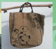
ジュート製のトートバッグ。 デザインも素敵です

みなさん、世界中のジュート生産量の約25%がバングラデシュで生産されていることをご存知でしょうか？バングラデシュでなぜジュート産業が盛んかというと、それは気候風土が適しているからなのです。この植物が好む高温多湿な気候に砂質土壌、さらに収穫後に繊維生産のために必要とされる大量の水、それら全てがここには揃っており、多くの農家が生産に取り組んでいます。日本へもバングラデシュ産のジュート製品が多く輸出されています。茎の部分の皮を利用した100%植物由来の材料ですから、廃棄する際の環境への負荷も小さいです。ゴミ問題が世界中で課題となっている中、今後もこの素材への注目が高まりそうです。