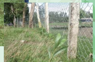
学校をぐるりと囲むフェンスに守られる苗