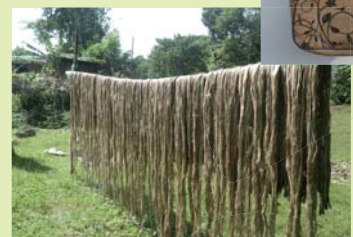
成長した茎の皮を利用します。 芯の部分は薪として燃料に