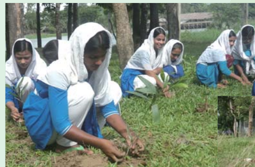
家畜による被害の心配がなくなり、生徒達も安心です

続けられる。それが一番嬉しいことだ」と喜びを語るとともに、より一層子どもたちに植林の意義を伝えながらの活動に力を入れることを約束してくれました。