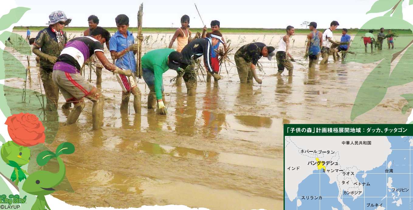
「子供の森」計画積極展開地域：ダッカ、チッタゴン