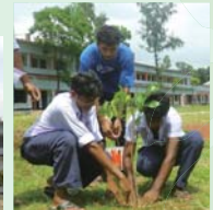
緑豊かな学校となるよう 増築中の校舎の前に植 林しました